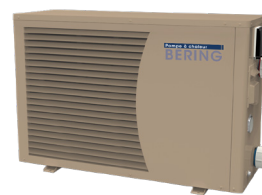
BERING INVERTER Excellente efficacité énergétique