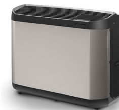
ZODIAC Z400 iQ Élégant et discret