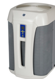
ZODIAC ZS500 Une solution économique et silencieuse